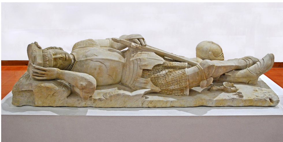
Fig. 4. Sepulcro del caballero de la Orden de Malta . Gil de Ronza. Hacia 1524-1525. Iglesia de San Juan de Barbalos (hoy en Museo de Salamanca)