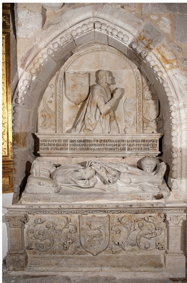
Fig. 3. Sepulchro de Pedro de Ayala y Juan de Ayala de Mella. Gil de Ronza. Hacia 1530. Iglesia de San Pedro y San Ildefonso, Zamora

y San Ildefonso de Zamora 34 (Fig. 3). A mi juicio, la más completa y rica de todas, pues se trata de un doble sepulchro, mural, enclavado en un arcosolio apuntado de rosca perlada en el ábside de la Epístola. Frente a estos recursos del último gótico contrasta el italianizante frontal de la caja, con roleos, del-fines, emblemas heráldicos y pilastras a candelieri . La imagen yacente corresponde a don Pedro, ataviado minuciosamente como caballero armado, con el yelmo a los pies y descansando sobre dos almohadones. Al fondo del arco, de perfil y en altorrelieve, aparece representado don Juan, su hijo, vestido también de caballero, con armadura y espada.