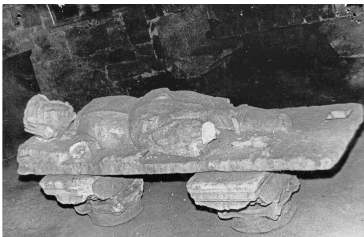
Fig. 5. Estado del sepulcro del caballero de la Orden de Malta hacia 1970.

las sedes “temporales” del Museo. En los días inmediatamente anteriores a su recepción, la Comisión de Monumentos y el cura párroco participaban al Obispado del descubrimiento y en virtud al convenio existente entre las partes se daba autorización y licencia para que los “restos de una estatua yacente”, y otras piezas, pasasen al Museo Artístico de la ciudad, debiendo indicar su procedencia al momento de la catalogación. 38