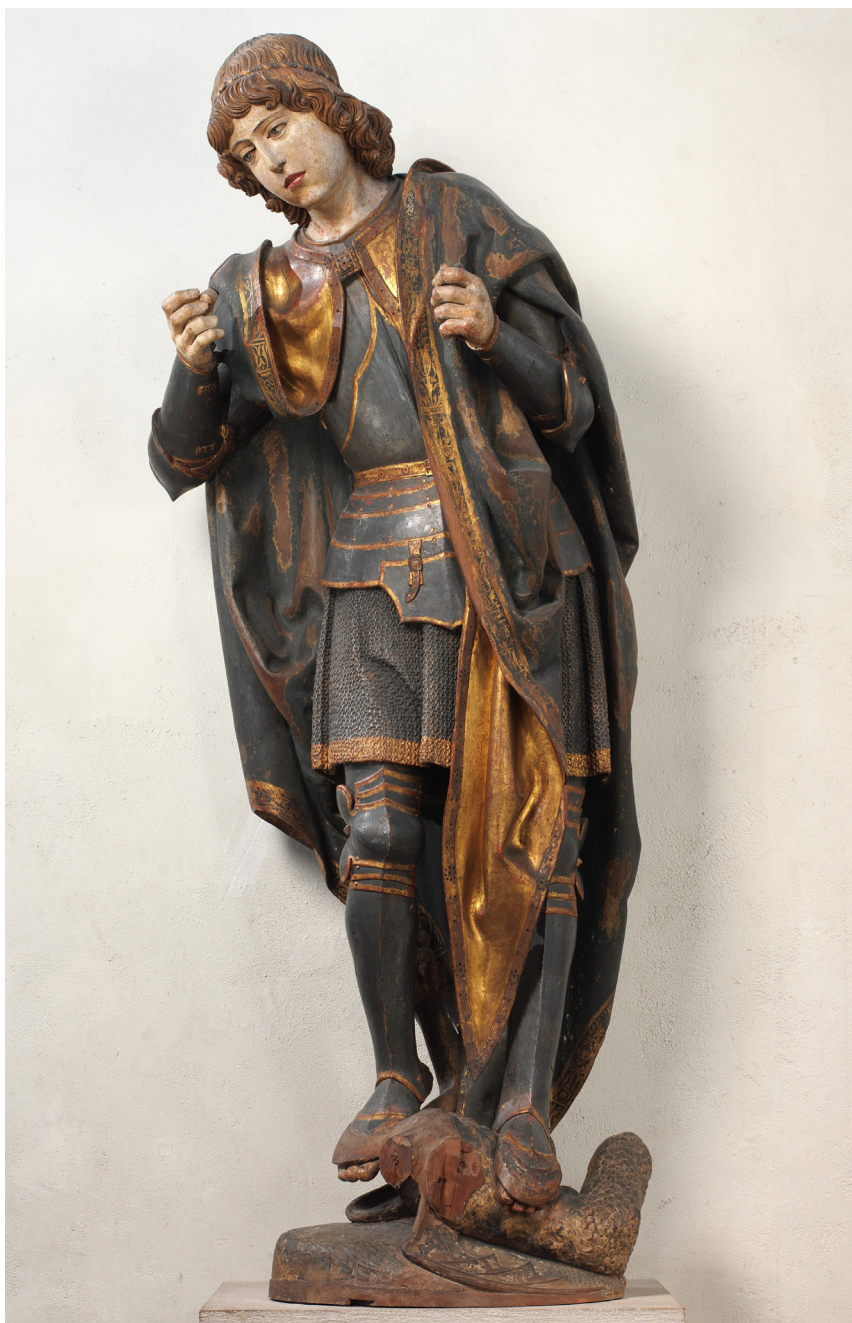
Fig. 13. San Miguel Arcángel . Gil de Ronza. 1522-1525. Capilla del deán Vázquez de Cepeda, convento de San Francisco de Zamora. The Metropolitan Museum of Art, Nueva York, The Met Cloisters in Gallery 20, https://www.metmuseum.org/art/collection/search/471459