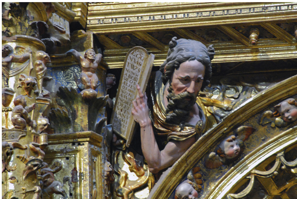
Fig. 1. Detalle del retablo del Santo Cristo . Arnau Palla. Hacia 1546. Capilla meridional de la Catedral de Zamora

Caso algo distinto será el de Arnau Palla (o Argnault Pailla), que aún aparece en algunos asientos contables zamoranos en el ecuador del siglo XVI (act. 1531-1552) y que, aparentemente, desempeñó un rol de escultor. De hecho, la exagerada expresividad de sus imágenes —además de su nombre—, siempre ha sido uno de esos elementos de juicio para reivindicar sus orígenes nórdicos. Su obra cumbre es el documentado retablo de Venialbo, 8 que ejecutó siendo vecino de Toro (Zamora) entre 1539 y 1546, aunque recientemente se le ha atribuido otro magnífico conjunto en la catedral de Zamora, el retablo del Santo Cristo 9 (Fig. 1). Sus indiscutibles dotes para la talla en tres