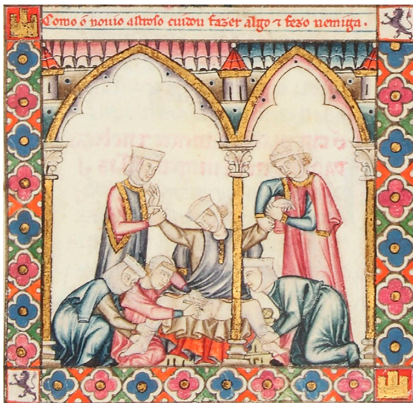
Fig. 3. Cantiga 105, detalle. Códice T-I-1. Patrimonio Nacional

La joven de la cantiga rechaza la propuesta de matrimonio que desean sus padres, pero aun así se celebra la boda. La mujer en la Edad Media se encontraba “en una sociedad masculina, gobernada por una teología masculina y con una moral hecha por hombres para hombres” 19 . Según Leah Otis-Cour 20 la tradición germánica consideraba dos etapas en el matrimonio: la entrega de la mujer por su familia al marido y posteriormente la confirmación de este acuerdo, mediante la cópula carnalis . 21 Así, aunque los novios fueron encerrados para que tuvieran relaciones sexuales, se observa en la figura 2 que estando la pareja en el lecho Santa María se sitúa entre ellos y consigue que la doncella mantenga su virginidad. La mujer rechaza con su mano izquierda cualquier acercamiento del esposo, que tiene los ojos cerrados pues