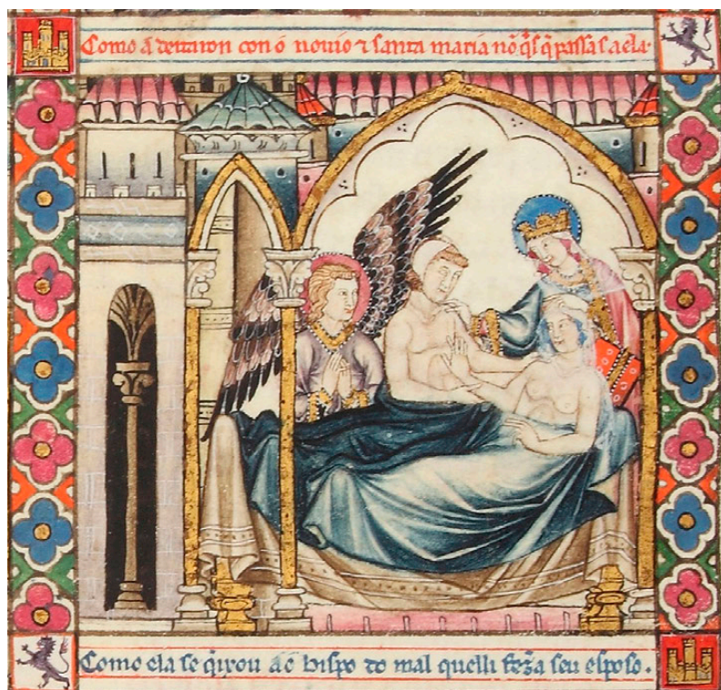
Fig. 2. Cantiga 105, detalle. Códice T-I-1. Patrimonio Nacional

puede uno por nada hablar de ello" 10 , pues los físicos de Pisa no pudieron cerrar la llaga (Fig. 3). Ella se quejó al obispo que para no enfrentarla a su marido la impulsó a volver con él.